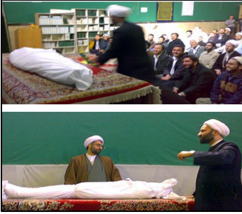
آموزش کفن پیچی در مدارس